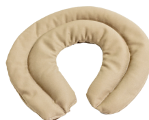
Verzwaringsdeken nekmodel kind - volwassene