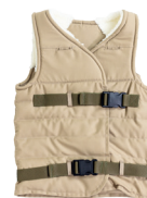
Verzwaringsvest kind - volwassene